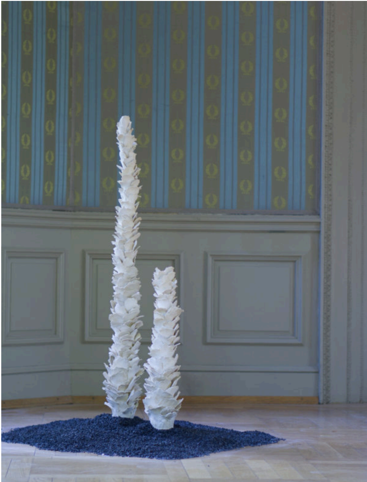
Arriba, un grupo de dos esculturas de gres de alta temperatura sin esmaltar sobre basalto (al igual que el resto de las piezas de la sala); a la derecha, una escultura de cerámica negra que fue cristalizada con sal durante más de un año.