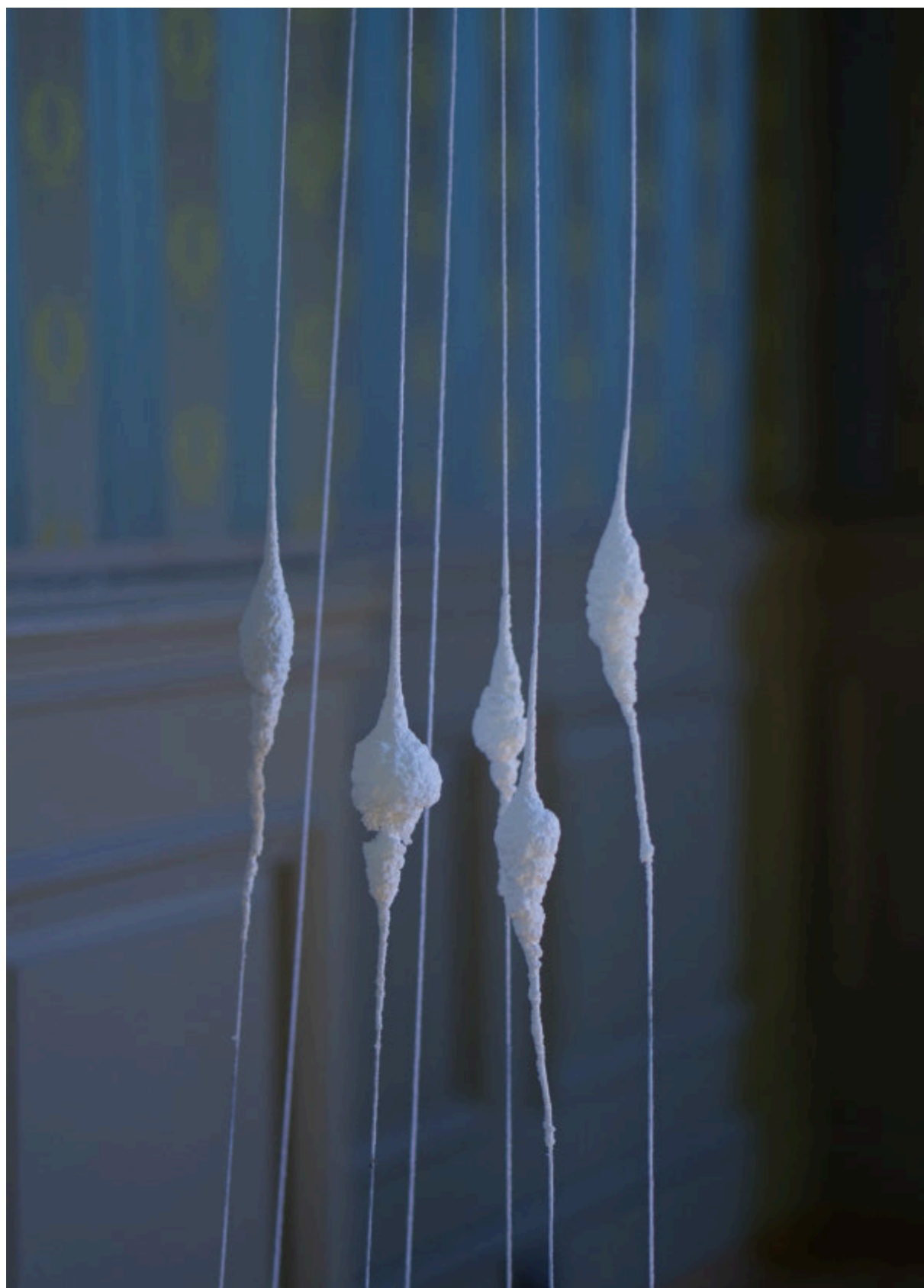
Arriba: estalagmitas de sal formándose sobre hilos de algodón. Derecha: estalactitas de sal que cuelgan de la lámpara principal de la sala.